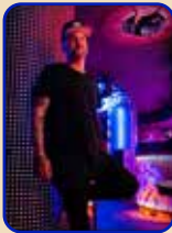
Actuación PIRATA Y MAKERENA Y EGONZALEZDJ